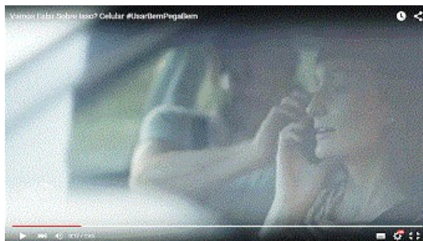
Figura 3 – Cena de uso do celular enquanto dirige um carro