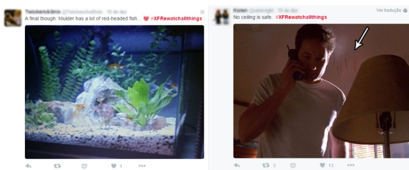
Figura 2: Os fãs de The X-Files ressaltam os detalhes cênicos do episódio All Things .

Os fãs de The X-Files também realizaram análises minuciosas das cenas, destacando os elementos cênicos e os enquadramentos do programa. Como, por exemplo, os peixes do aquário de Mulder (David Duchovny), os emblemáticos lápis fincados no teto e pôster com os dizeres ‘ I want to believe ’ colado no escritório dos agentes, tudo foi destacado pelo público. Cada cena da trama era destrinchada no Twitter em busca dos detalhes da série.