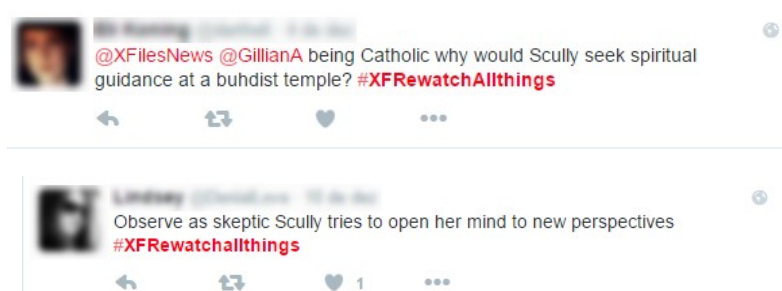
Figura 1: Os fãs de The X-Files repercutem as atitudes subjetivas de Scully (Gillian Anderson).

Outra questão destacada pelo público no Twitter é que mesmo sendo adepta ao catolicismo a agente do FBI passa, repentinamente, a acreditar nos ensinamentos do budismo. Nesse contexto, os tuítes indagavam o comportamento de Scully (Gillian Anderson) contrapondo com o paratexto da série.